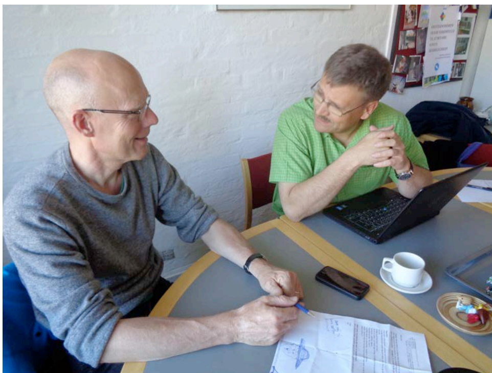
Endnu et billede af den seriøst arbejdende bestyrelse