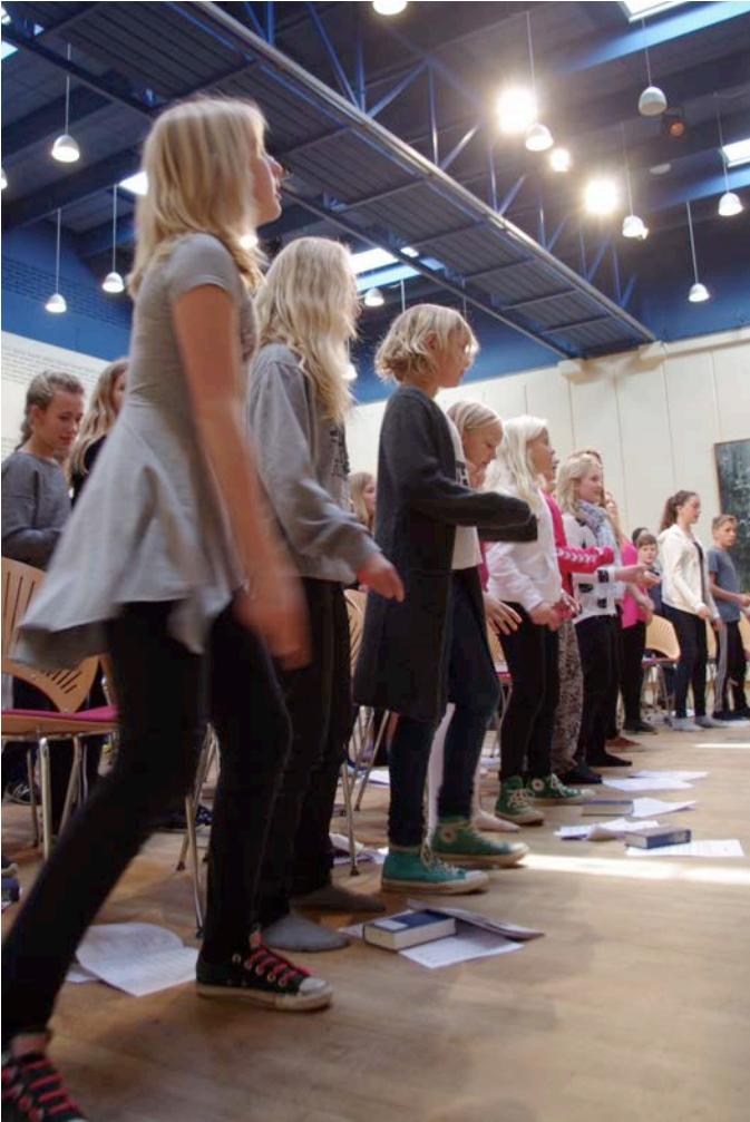
Sang og bevægelse på stævnet

sig selv senere med et lille bidrag i dette nummer af Pulsen.